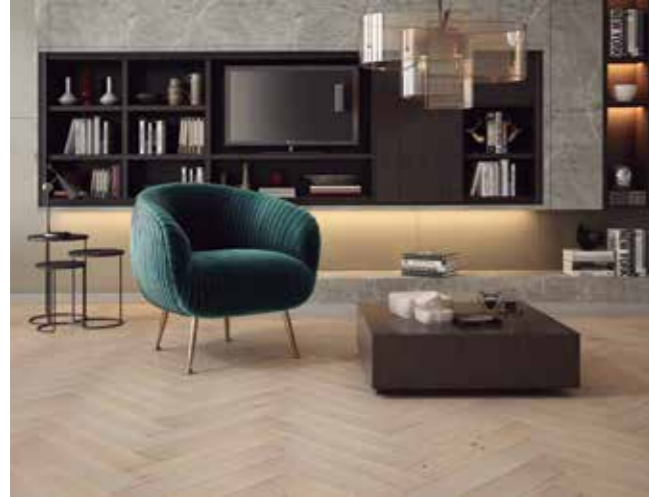
Foto: Suelos de madera natural, MADERAS DE AUTOR. Por Distiplas Floors Maia-Otto

Cerámicas Aparici. Igualmente, desde Hisbalit completan la información indicando que la personalización sigue siendo la tendencia en revestimientos de exterior. Se busca calidad y funcionalidad, pero también estética y creatividad, ya que la ambientación es muy valorada por los clientes. “En las piscinas la tendencia es la apuesta por mosaicos que consigan un color de agua sorprendente: verde esmeralda, turquesa, efecto espejo. Los mosaicos con efectos tornasolados siguen en tendencia, también los mosaicos inspirados en los arrecifes de coral”.