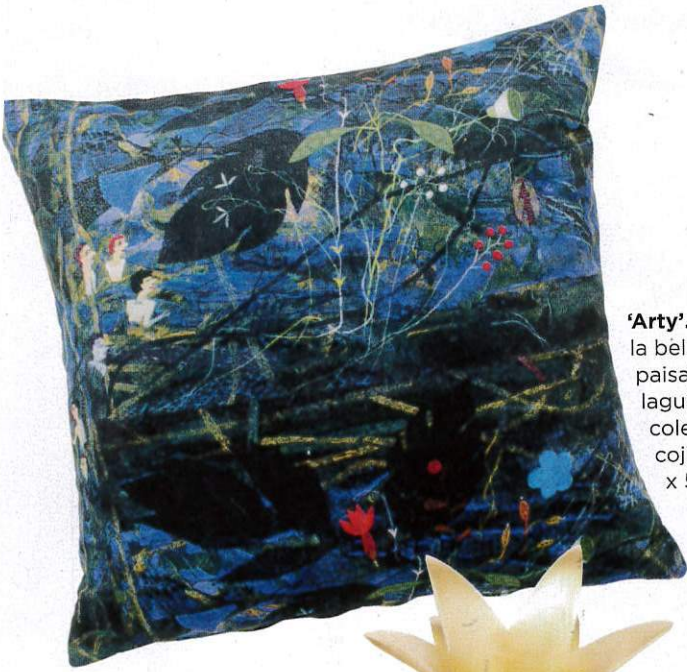
'Arty'. Ikea recupera la belleza de los paisajes y las lagunas para su colección Avsiktlig: cojín (algodón; 50 x 50 cm; 13€).