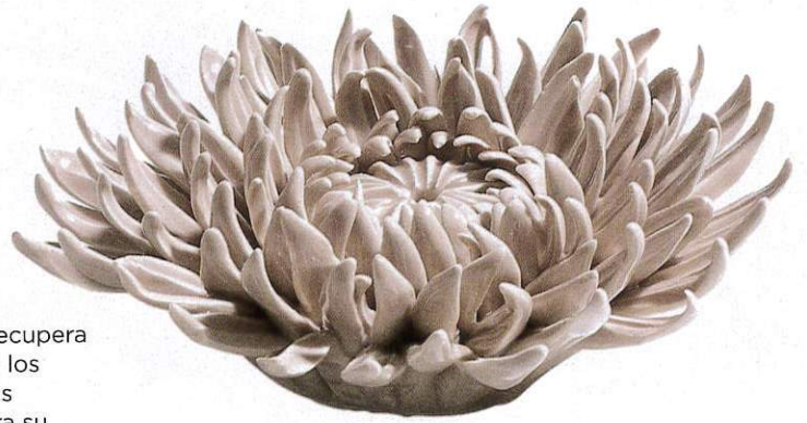
Explosión floral. Strej es una hermosa flor marina de cerámica (6 x 14 cm de Ø; 38€), de la danesa A Simple Mess , en Estilo Nórdico .