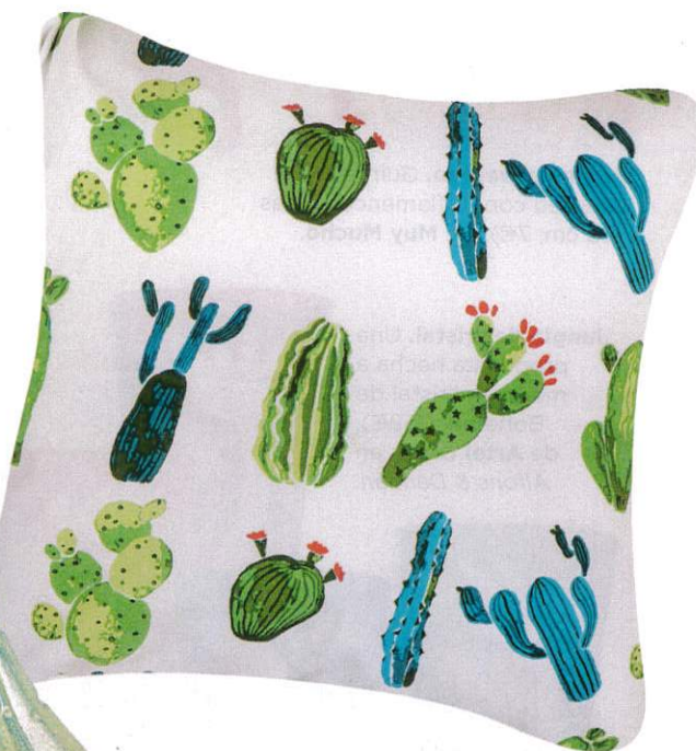
Desierto multicolor. Funda de cojín Cactus (10€), de Casa Viva . Un modelo cromático que apuesta por dos colores en tendencia: verde y azul.

LAS PIEZAS HECHAS A MANO Y EL 'ANIMAL Y TROPICAL PRINT' SON LAS ESTRELLAS DE LA TEMPORADA