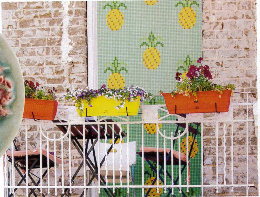
Recicla y customiza. Mosaico en vidrio reciclado (desde 130€/m 2 ), una propuesta de Art Factory, el servicio de personalización de Hisballit .