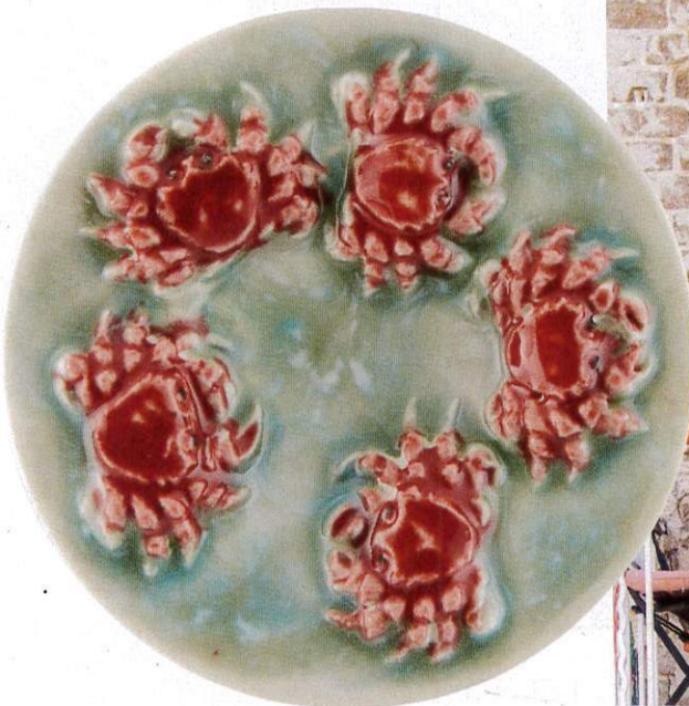
Pequeña belleza. Porque lo bello está en todas partes... imán de nevera (2 x 11 cm; 15€), de Bordallo Pinheiro .