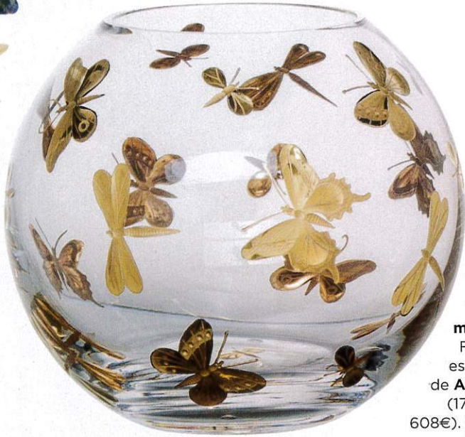
Vuelo de mariposas. Fly Fusion es un jarrón de Artel Glass (17 x 20 cm; 608€). En Alfons & Damián .