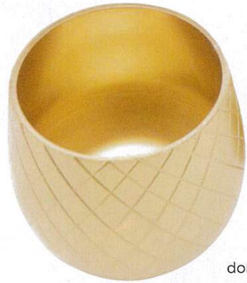
El mejor cóctel. Mezclador en forma de piña en acero inoxidable dorado (20 x 10 cm; 93€), a la venta en eBay .