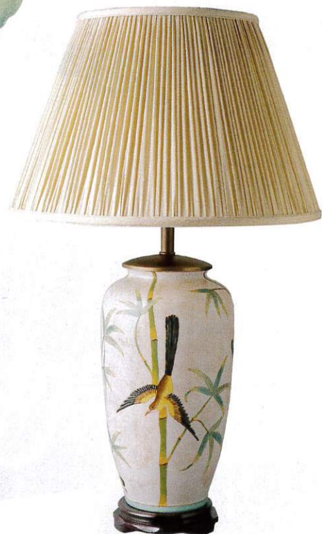
Ikebana lumínico. Los motivos orientales son una buena apuesta cuando se busca decorar con ligereza. Lámpara (199€), de El Corte Inglés .