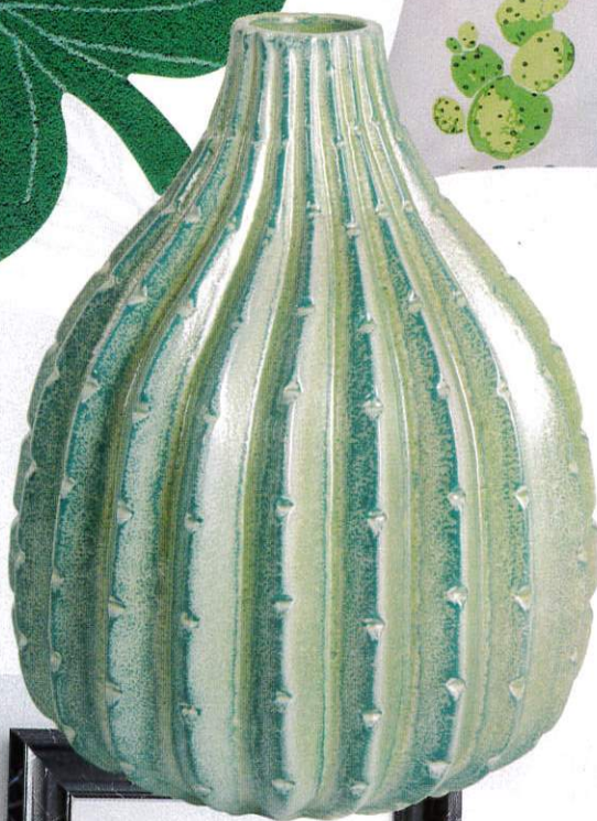
Sobria loza. Los motivos inspirados en la naturaleza cobran vida esta temporada. Un buen ejemplo de ello es este jarrón: Cactus (16 x 20 cm de Ø; 17€). De Habitat .

LAS PIEZAS HECHAS A MANO Y EL 'ANIMAL Y TROPICAL PRINT' SON LAS ESTRELLAS DE LA TEMPORADA