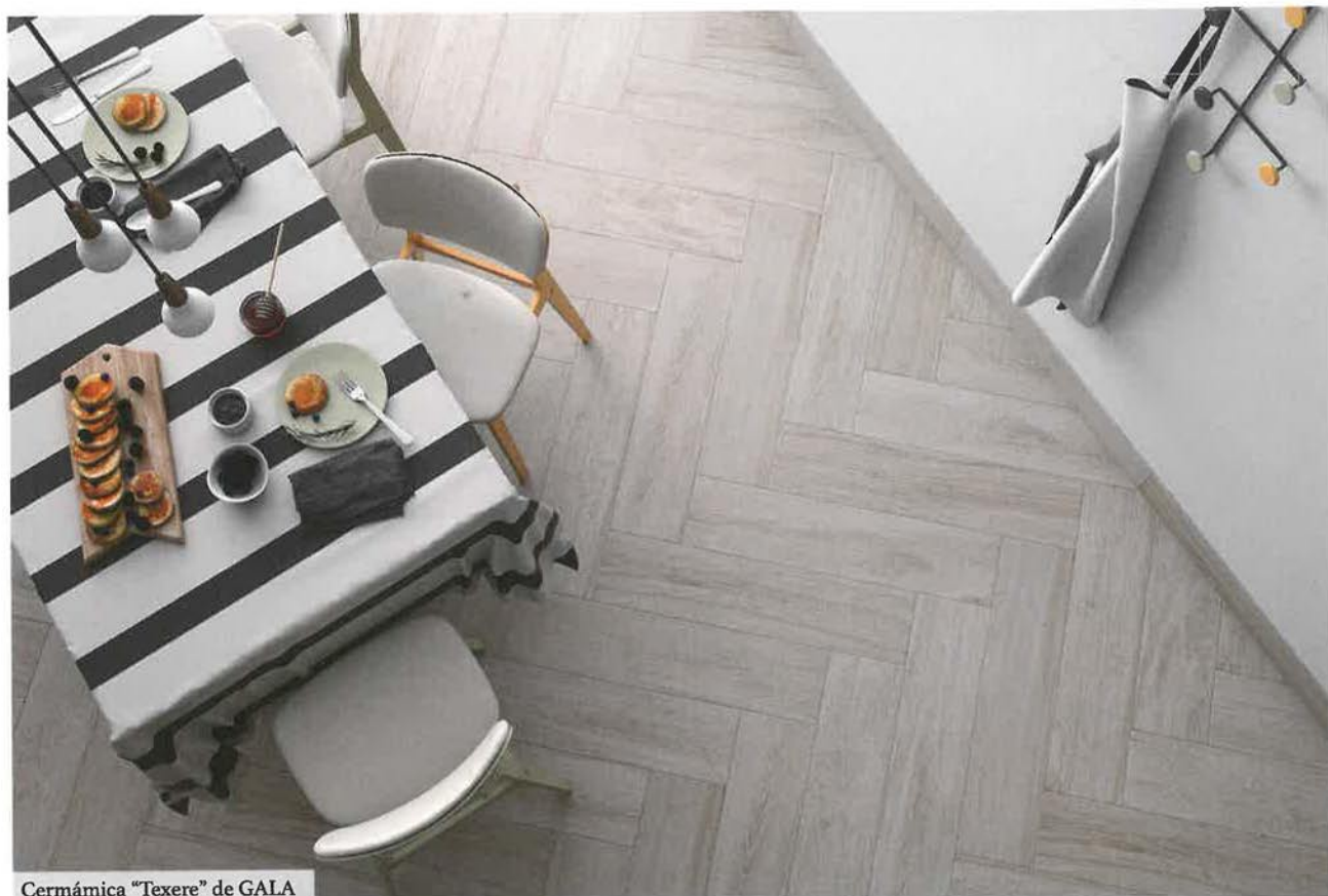
Cermámica "Texere" de GALA

LA BÚSQUEDA DE MATERIALES MEJORADOS QUE OFREZCAN POSIBILIDADES ESTÉTICAS INÉDITAS, FACILITEN EL MANTENIMIENTO Y INCREMENTEN LA RESISTENCIA SON ALGUNOS DE LOS OBJETIVOS DE LAS PROPUESTAS ACTUALES.