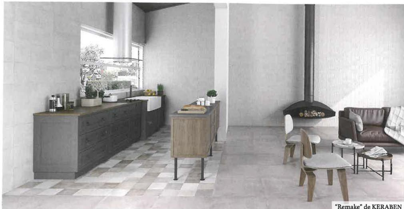
"Remake" de KERABEN