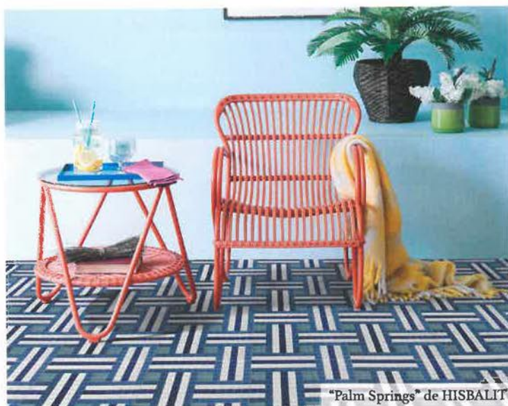
"Palm Springs" de HISBALIT

Desde los de inspiración orgánica, hasta los motivos coloristas de los '60, pasando por los aires zen traídos de Oriente y los sofisticados óxidos, cementos o maderas desgastadas, que reafirman el estilo industrial, las posibilidades actuales reúnen un buen número de estilos, formatos y acabados. Además de estas propuestas estéticas, la aplicación de técnicas decorativas mediante láser o inyección de tinta permiten personalizar aún más la oferta de los fabricantes, sin renunciar a las grandes tiradas necesarias para rentabilizar la renovación continua de sus catálogos.